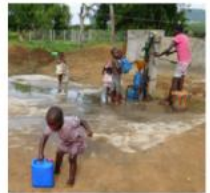
Waterkraan Budjala / Congo

Maar nog vervelender als er maar twee waterkraantjes in heel de provincie Antwerpen zouden staan: eentje in Essen en eentje in Mechelen. Absurd?